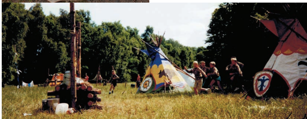
Sommerlejr Temnæs 2001, ovenfor tv. stifinder skjolde