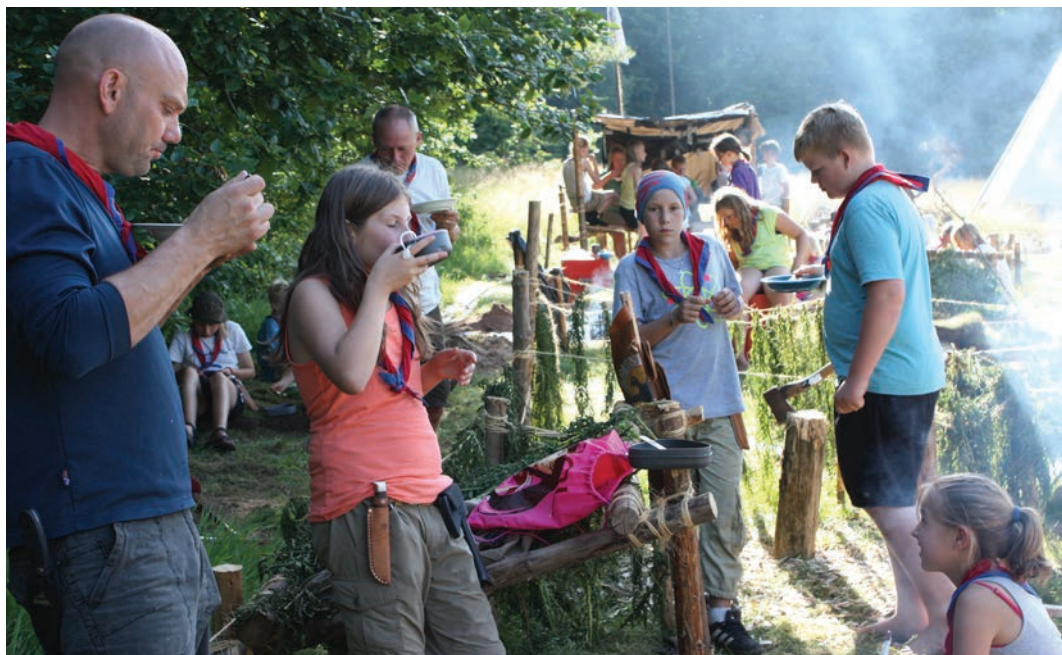
Stifinderne laver thai-suppe på sommerlejren 2011, med fisk de selv har fanget