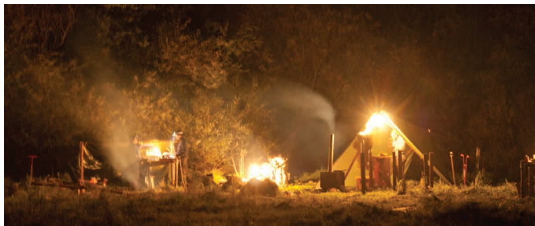
Pioner og roverturering 2011

Vi havde valgt ikke at gå op på toppen af bjerget den første dag, men ligge os ca. 2-300 meter under toppen på et slags plateau, som vi kunne se fra bunden, ikke var langt fra en stor bunke sne, så vi var sikre på vand til suppen