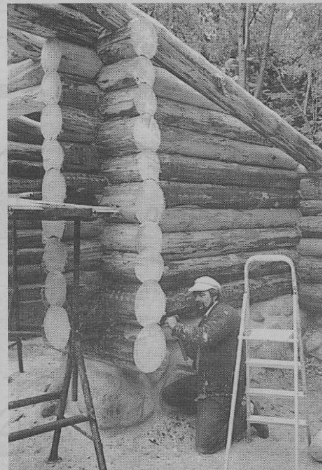
En stor gruppe forældre er med til at bygge "århundredets bjælkehytte" til De Gule Spejdere i Nødebo.

se for at betale kloakbidrag (engangsudgift for at udlede spildevand til rensningsanlægget), men ellers er der gruppens holdning, at man skal klare ærterne. Dog har Sct. Georgs Gilderne i